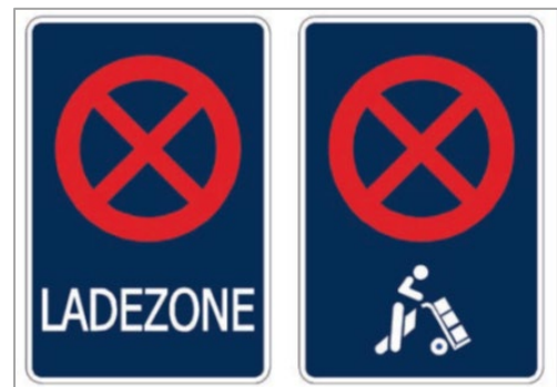
Abbildung 3: Vorschlag für Verkehrszeichen „Ladezone“

Die Vorteile wären: Der klare Regelungsgehalt ist, dass für alle anderen Verkehrsteilnehmer hier absolutes Haltverbot gilt, denn die Beschilderung von Verkehrsflächen für bestimmte Halt- oder Parkvorgänge (Zeichen 224 StVO „Haltestellen“ sowie 229 StVO „Taxenstand“) ist mit Haltverbotregelungen für andere Verkehrsteilnehmer verbunden. Aufgrund der eindeutigen Sanktionsmöglichkeiten würde die Falschnutzung von Ladezonen rapide sinken und die Wichtigkeit der Freihaltung im Bewusstsein der Verkehrsteilnehmer verankert werden, wie das bei Haltestellen und Taxiständen der Fall ist.